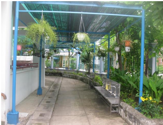
HÌNH ẢNH VỀ XÂY DỰNG CẢNH QUANG “XANH – SẠCH – ĐẸP” TẠI TRƯỜNG MẦM NON HOA HỒNG